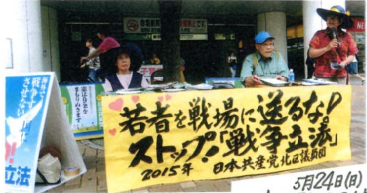
2015.5.2 「たがひらレポート」No.131

「日本国憲法の立憲の精神を蹂躪(じゅうりつ)する行為を、絶対に認めるわけにはいかない」として、日本の代表者に、国、人種、民族、文化、宗教などの差異を超え、互いに尊重しあえる『真の平和』を武力ではなく、『積極的な対話』によって実現することを世界の人人々に強く提唱するよう求めています。