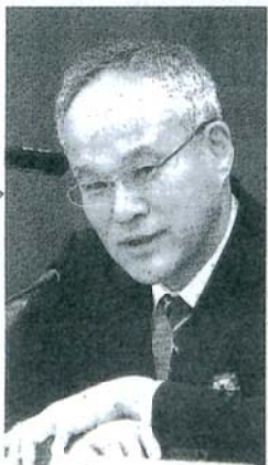
長谷部恭男参考人（早稲田大学法学学術院教授）=4日、衆院憲法審査会