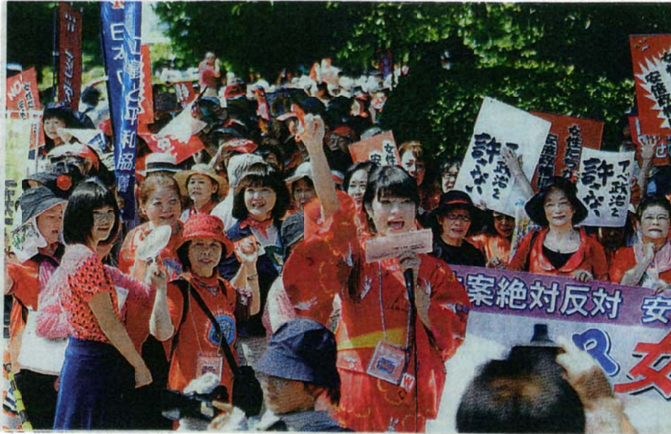
手をつないで抗議のコールをする「女の平和」の参加者=20日、国会正門前