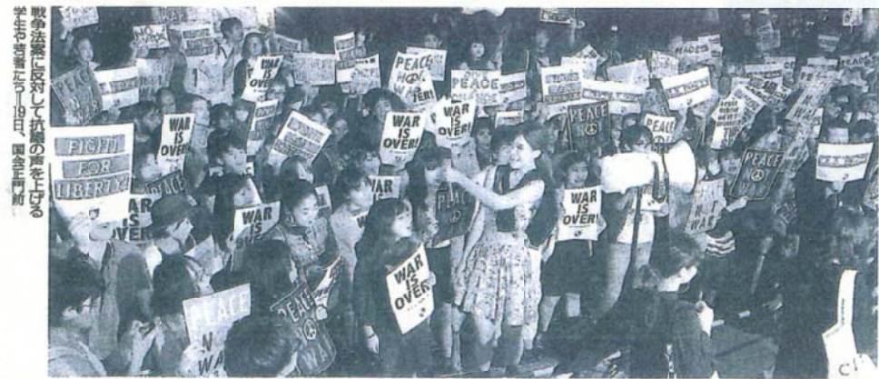
戦争法案に反対して抗議の声を上げる 学生や若者たち=19日、国会正門前