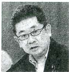
質問する小池晃議員＝25日、参院厚生労働

住民票の住所をお知らせください <マイナンバーによるサービスの実施のため、ご協力ください。> 宛番号制度を創設するための法律(注)が制定されたことにより、(マイナンバー)により住所変更届を提出する必要があります。 は、大変お手数ですが、マイナンバーによるサービス実施の住民票の住所をお知らせください。