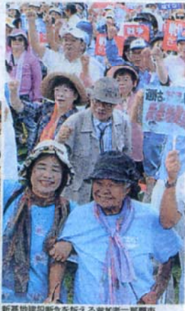
新基地建設断念を訴える参加者—那覇市