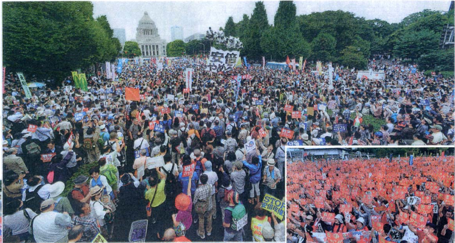
国会を取り囲み、戦争法案廃案、安倍首相退陣を求めてコールする人たち—30日、国会正門前

戦後70年のことし、8.30の総がかり 全国100カ所、国会前12カ所の歴史の白。