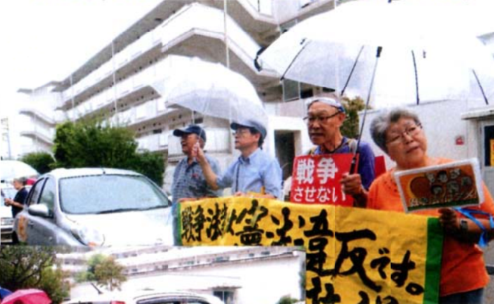
9月6日の日曜日。 「シニアズ」の第2回目 宣伝活動がありました。