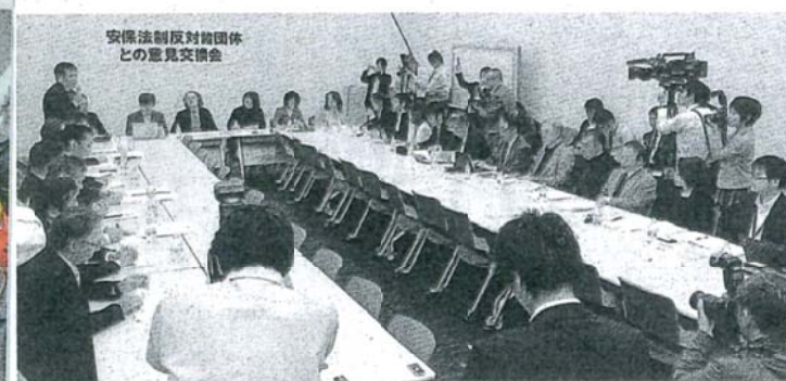
戦争法に反対する6団体と5野党の意見交換会=18日、参院議員会館

● 10月16日(金)戦争法に反対してきた諸団体と、日本共産党や民主、社民、維新、生活党の5野党が、国内的意見交換会をおこないました。そして、今後、定期開催を確認。