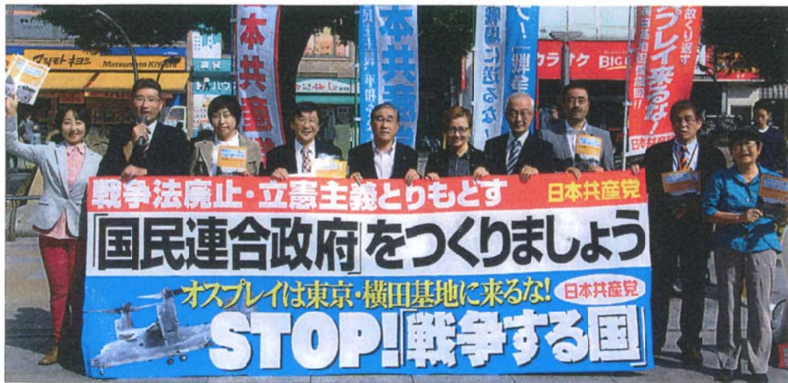
戦争法廃止を訴える日本共産党北区議員団と池内さおり衆院議員(右から5人目) = 10月18日、赤羽駅東口