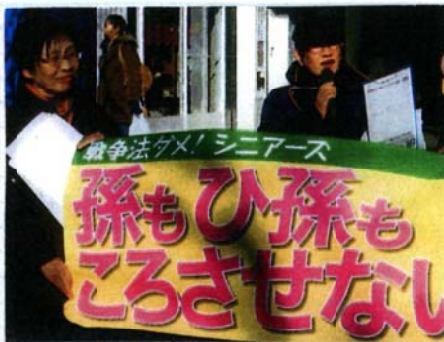
戦争法ダメ! シニアズ 赤羽西口で19日行動