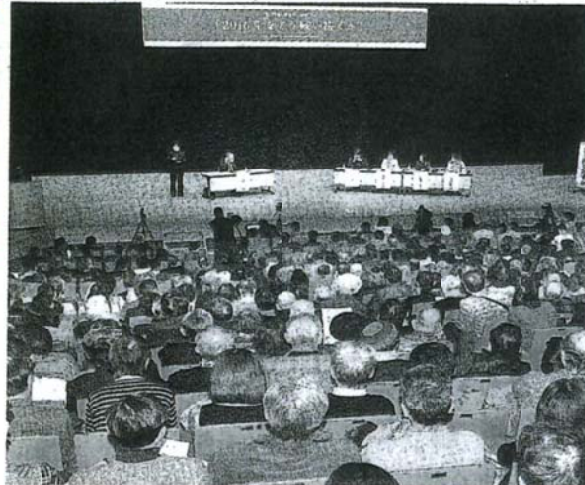
「2016年をどう戦い抜くか」でパネルディスカッションを聞く人々=23日、東京都北区