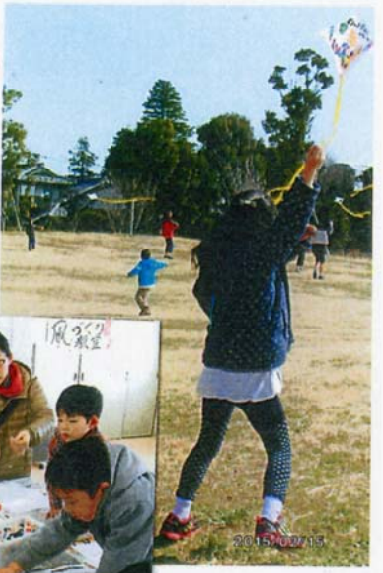
2015年におこなわれた 1回 凧作り教室と 凧あげ大会の様子