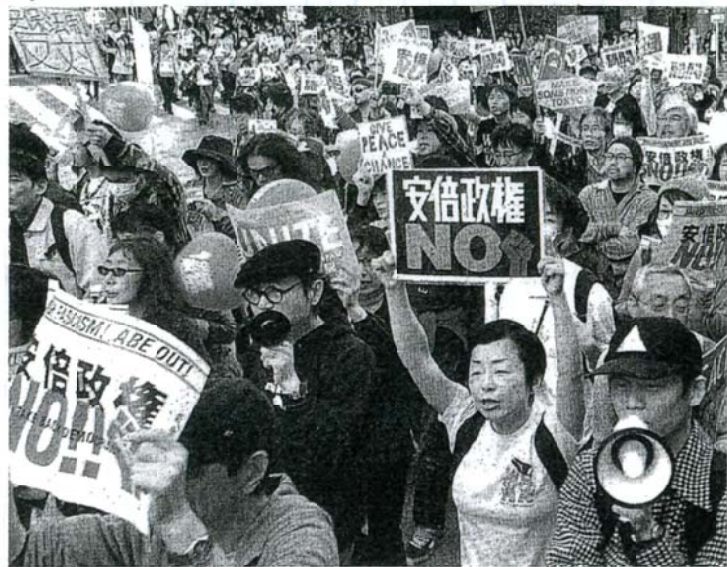
「安倍首相はやめろ」「野党は共闘」と、繁華街をアピールしながら行進する人たち=14日、東京都渋谷区。

②まったくひどい話ではありませんか。株価を上げるために年金積立金を多額に投じてきた安倍首相のアドミクス。