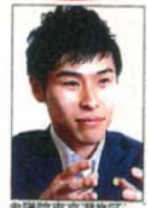
参議院東京選挙区 山添 拓 やまぞえ たく