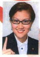
衆議院議員 池内さおり いけうち