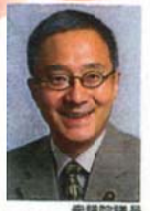
衆議院議員 笠井 亮 かさい あきら