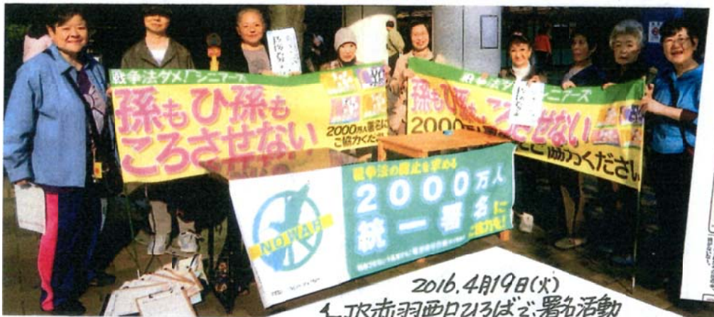
2016.4月19日(火) LJR赤羽西口ひろばで署名活動 この日は、熊本巨大地震の救援募金もよびかけました。