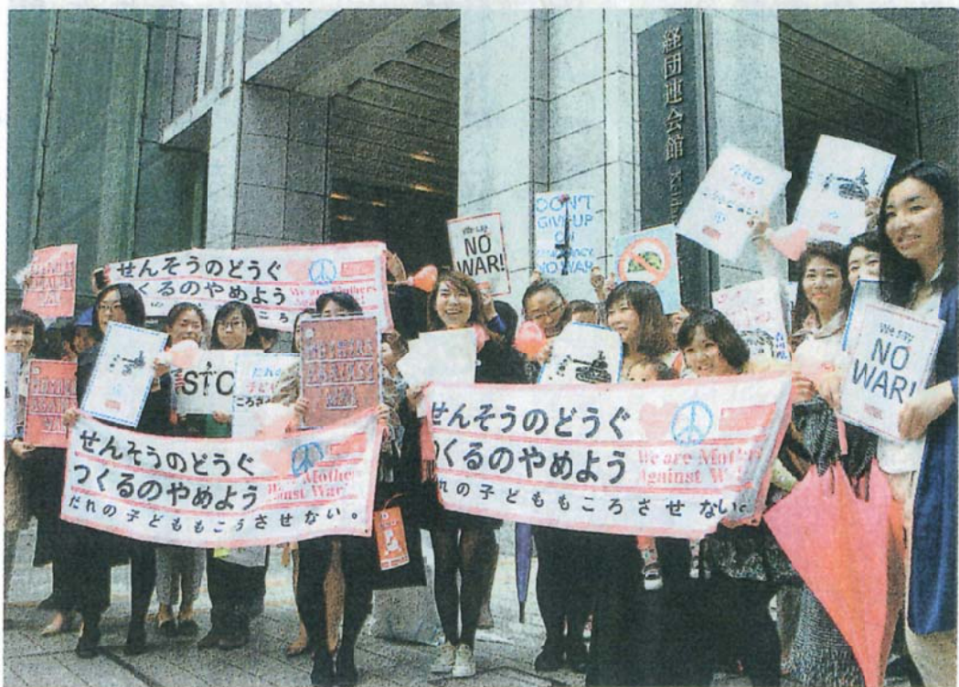
4/15付「しんぶん赤旗」より 「武器づくりやめて」と訴えるため全国から集まったママと子どもたち=4/14、東京・千代田区の経団連前 ~◎ 4月14日、「ママの会」は、5月5日のこどもの日に新宿で、また5日~8日をおひけた~