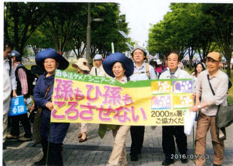
「だれのこどもも ころさせない」の 「ママの会」のよびかけにこたえて...シブス