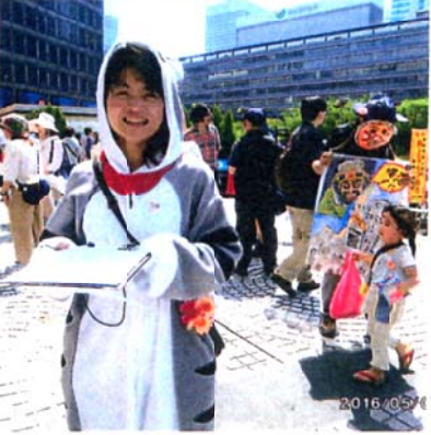
「こどもの未来を守りたいから」と、ママ。5/5

◎昨年の夏に誕生した「ママの会」は、ネットつながり、現在47都道府県で結成されています。◎昨年には、「武器づくりやめしと、千代田区の経団連を訪れ、要請をしています。◎「ママの会」の行動力に私も励まされています。