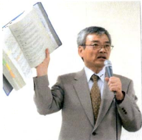
4道路計画の方向性を告げる。都議

◎ 都民の怒りは、日に日に強まるばかりです。「もう、都知事は辞めてもらいたい」「諸国会見を見るたびに、腹が立つ」「都民の信頼を裏切った」と。