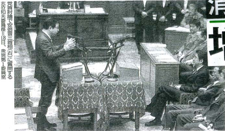
党首討論で安倍晋三首相(右)に質問する志位和夫委員長(18日、衆院第1委員会)

このとき安倍首相は「好循環実現のための経済対策」を実行すれば、増税の影響を緩和できるとして増税中止を拒否しました。警告を無視し、増税を強行して国民の暮らしと日本経済を戦後かつてない状況に陥れた責任は重大です。