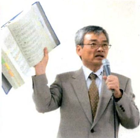
4道路計画の方向性と告発を、そね 都議

70年前の道路計画は住民追い出し、 商店街を壊す... オリンピックの 東京招致に買収の疑惑の中