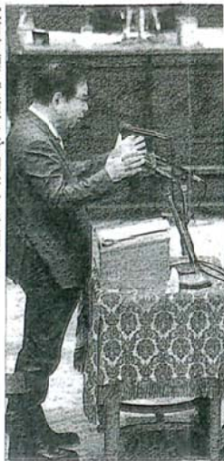
党首討論で安倍首相(右)に質問する志位和夫委員長(左)と、衆院第一委員会室