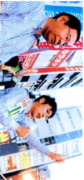
志位和夫委員長(左)の応援をうけ訴える山添拓候補(右) = 7月7日、赤羽駅東口

日本共産党は、参院選挙で掲げた公約実現に奮闘するとともに、引き続き政治戦で野党共闘、市民のみなさんとの共同で勝利をめざします。