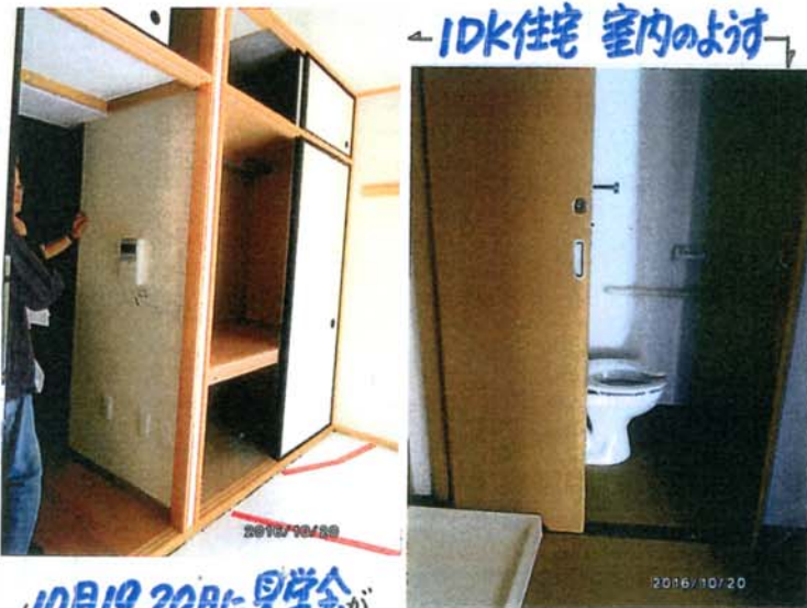
1DK住宅 室内のようす