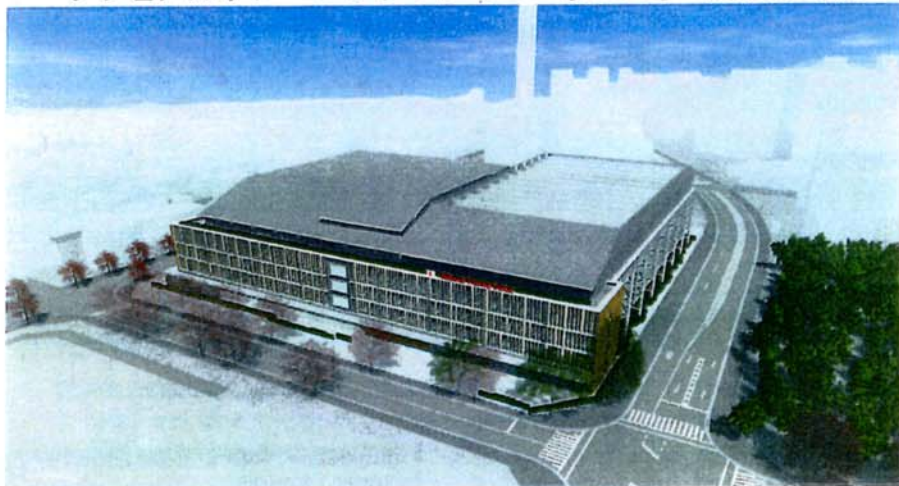
2016.11.17. Tさがらしレポート No.1443.