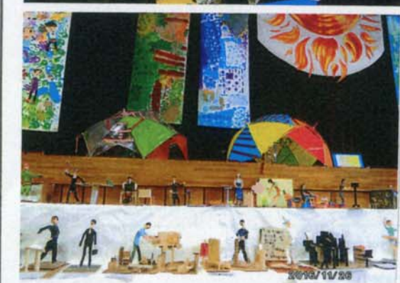
赤羽台西小の展覧会での作品