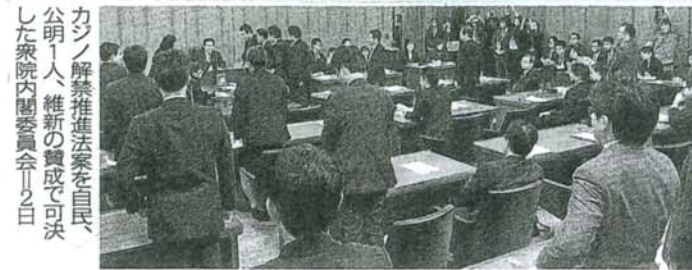
カジノ解禁推進法案を自民・公明一人、維新の賛成で可決した衆院内閣委員会(11/20)