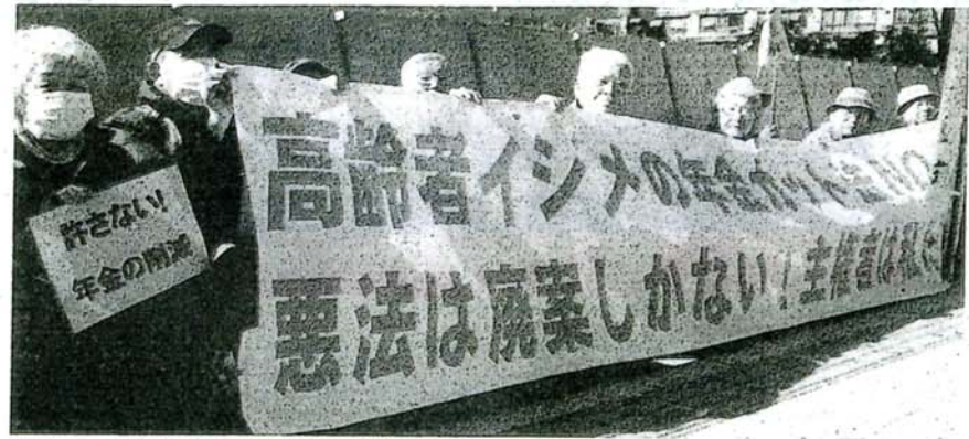
年金カット法案の廃案を求めて国会周辺で座り込む高齢者ら=18日、東京都千代田区