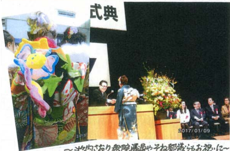
～池内さおり衆院議員やそのね都議からも祝福に～

◎1月9日(月祝)、小雨の中でしたが、北とぴあ・さくらホールの会場は2階がいっぱい。「ひとりひとりの持ち味を生かして成長」と決意。