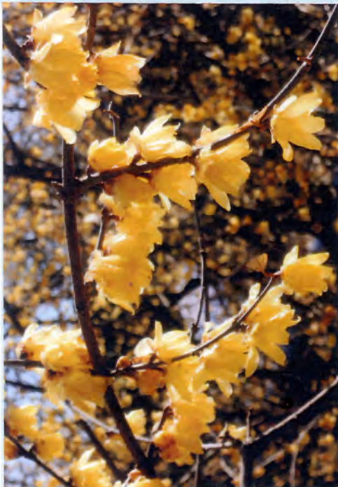
安中市・ろうばいの郷

● 共産党は、待機児解消と拡充のために、認可保育園を4年間で9万人と提案。保育士の給与引き上げ、建設用地貸しに固定資産税などの減免措置創設も提案。