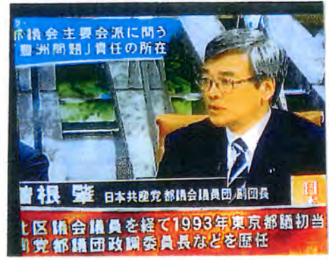
日本共産党都議会議長、副議長、区議会議員を経て1993年東京都議初当選、都議団政調委員長などを歴任

「おはようございます。早いですね。もう3月7日。あすは、3.8国際婦人デーです。長時間労働の解消と過労死の根絶こそ——日本共産党は、真の「働き方改革」と、緊急提言を発表しました。」