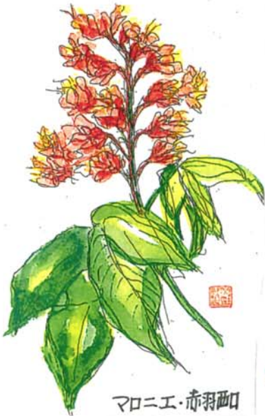
マロニエ・赤羽西口