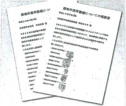
築地5町会が連名で築地市場再整備を求めた嘆願書

「嘆願書は、都の市場問題P-Tが3月に発表した「築地市場の再整備計画」を評価しています。