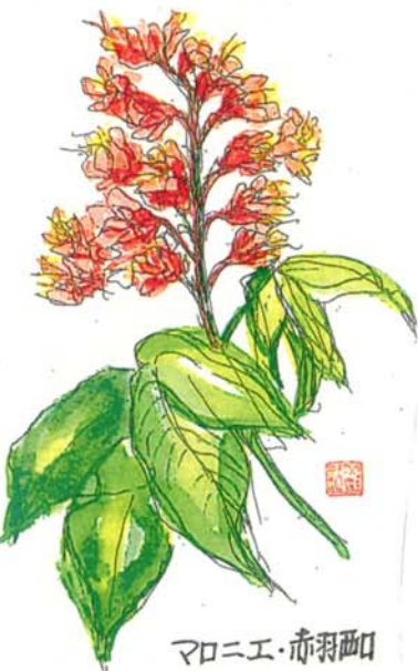
マロニエ・赤羽西

ちょっと立ちどまって、上を見て下さい。 日本のトチキと区別し、セウチキと。 パリでは街路樹として有名。