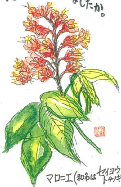
マロエ工(和名はセイヨウトウキ)