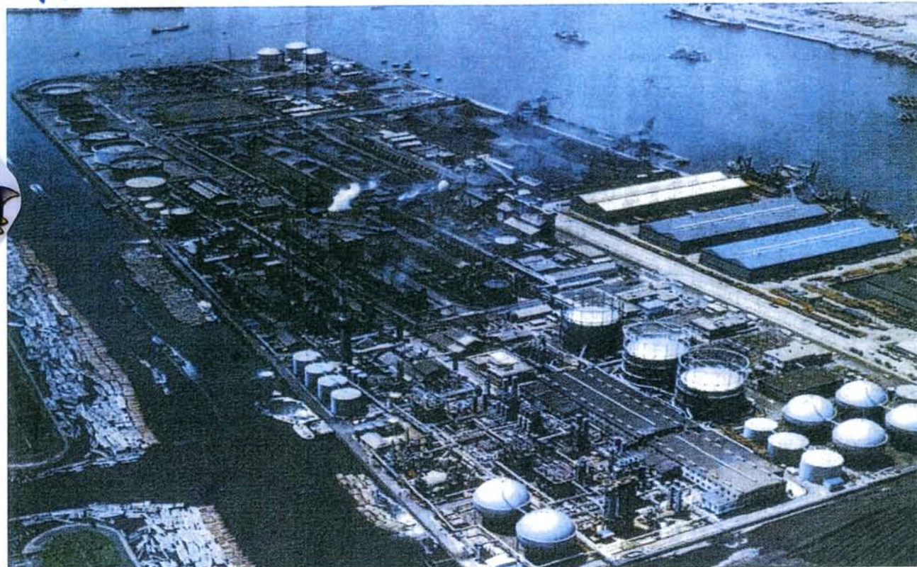
操業当時の東京ガス豊洲工場

（公有海面） 東京ガスは海を埋めた。さらに敷地を拡張。32年間豊洲で都市ガスを製造した。