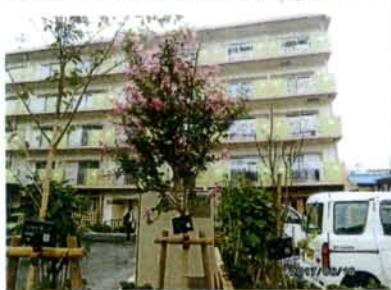
旧北園川あとのシルバーニア赤羽北

● 3日間の受付です。● 65歳以上の単身、区内に7ヶ つき2年以上居住など。H28年の所得256万884円 以下。