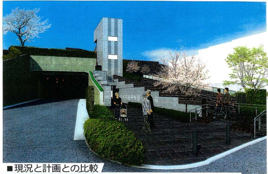
■現況と計画との比較