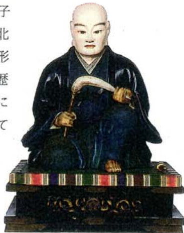
木造太田道灌坐像

厨子は天保6年(1835)7月の道灌350回忌の際に、太田資始によって寄進・奉納されたものです。材質は檜が使用されており、扉の左右の裏面には木彫の桔梗紋がつけられ、天井から垂れ下げられた木製の幡には雲をかたどった文様が描かれています。道灌の命日にちなみ、毎月26日には厨子の扉が開かれ像を拝むことができます。像は道灌が没してから200年以上も後に造立されたものではありませんが、その風貌を伝える唯一の木像として大変に貴重であり、厨子とともに北区指定有形文化財(歴史資料)に指定されています。