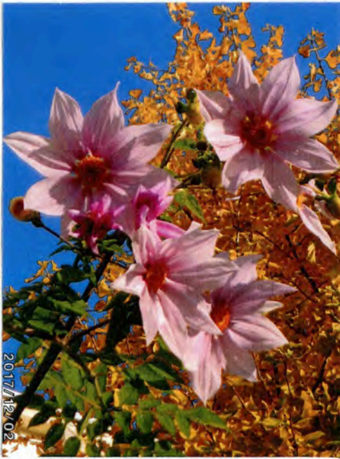
~桐郷小の校庭で、皇帝ダリア~

才4定例区議会報告 区民事務所の7の分室と全廃する条例改正条例案を、自公、民進両派が賛成し、来月10月廃止へ。「住民の意見は聞かないまま、全廃はやめるべき」 「コンビニ交付にはマイナンバーカードが必要だが、11%の区民しか持っていない」 「高齢者などの相談窓口として、大きな役割も果たしている分室だ」と、全廃方針の撤回を求め、共産、新社会、社民などが反対を表明した。 つきつぎ、議会と区民の声を訴えつづける。