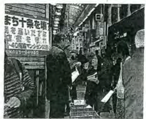
十条銀座で宣伝する住民団体=11月19日

11月30日に開かれた北区議会十条まちづくり特別委員会で、区は、十条駅付近で進められている埼京線連続立体交差化、鉄道付属街路、補助85号線という3つの都市計画が決定・告示されたと報告。日本共産党は、住民合意のない計画決定を厳しく批判しました。(のの山けん) 十条駅付近の連続立体交差化は、もともと旧国鉄と北区の間で、地下化による施工が約束されていたのに、東京都は「高架化」案を示していました。事業説明会の場でも、都市計画案に対しても、多くの住民が地下化での施工を求めています。飯線確保のため北区が整備する附属街路では、約120棟が立ち退きを迫られます。補助85号線は、現在18分の幅員を30分に拡張する計画で、沿線に並ぶ、いちよう通り商店会は、駅西口再開発とあわせ、ほぼ全面撤退を強いられます。