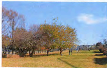
自然観察公園とスポーツの森公園の間の広場

今は草地なので、子どもたちは虫取りや凧あげをしたり。公園利用者はこの草地を通して、2つの公園を自由に行き来しています。