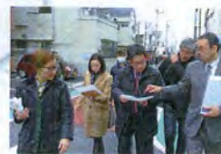
日本共産党の志茂86号線視察

北本通りから清掃工場のある周辺が志茂の地域。補助86号線はまちを分断します。「70年も前の道路計画で、静かなまち並みと築いてきたコミュニティを壊さないでほしい」と、区内でいち早く国を相手にした裁判に踏み切りました。今年の夏以降、73号線、十条駅西口再開発、赤羽西86号線でも、住民の提訴が広がっています。