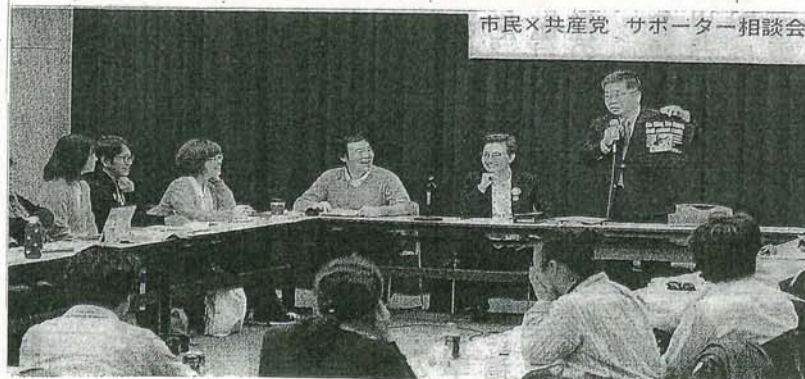
市民×共産党 サポーター相談会

衆院東京3区の勝手連で活動した女性(44)は「自主性が全て」と、強要されないことの大切さを発言。「100円募金する人を100万人つくれる制度にしてほしい。そうすれば、共産党へのデマに一言『違うんじゃないの』と言いつける人が広がるのでは」と語りました。 19歳の女子学生は「宣伝物のデザインを、サポーターと話し合う場があるといい」と提案。町田市の女性は「市民と、共産党・後援会が互いにリスペクトの気持ちをもってやれるようにしたい」と話しました。