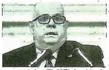
ホーガン知事