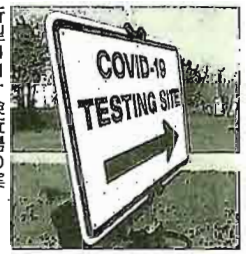
新型コロナウイルス検査場の案内板(メリーランド州政府のウェブサイトで)

メリーランド州は9日までに、約135万の検査を実施。検査した州民は99万人におよび、人口の16%にあたります。当初、数千だった1日の検査数も現在は2万以上。24郡(ボルティモア市含む)のすべてで検査率10%を超えました。