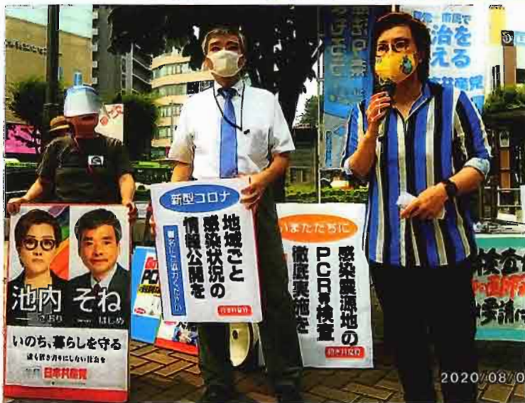
〜 8月8日(土)赤羽西口みばこにて〜