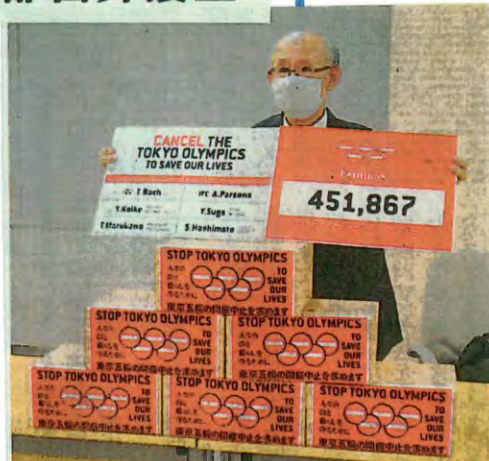
東京五輪の中止を求める署名の提出を報告する宇都宮健児弁護士=15日、東京都庁