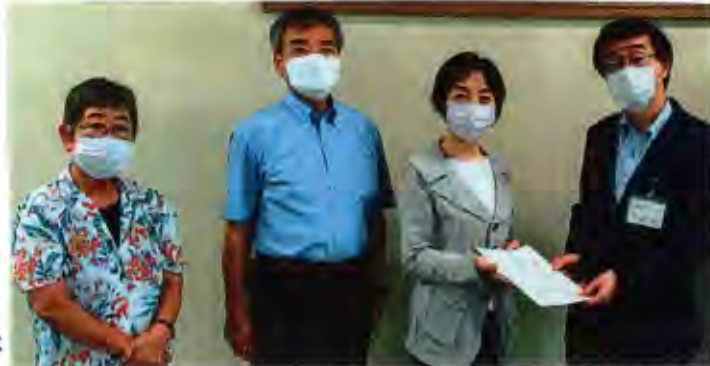
<写真> 右から 清正(せいしょう)浩靖地 教育長、山崎区議、それをはじめ都議、さがら区議

子どもたちにとっての 安心と安全の場を。 そして、 学びの機会を止める ことのないようにしたい」と、 と、教育長の決意が語られました。