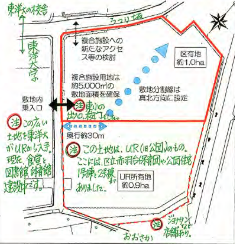
【別図】4(3)「土地譲渡先に求める公共的施設等」のイメージ図

旧赤羽台東小の敷地約半分に、北区が児童相談所など4つの子育て総合施設を計画。UR(旧公園)と学校の残り半分の土地を合わせて、民間に売却して、マンションやゲートウェイなど。11/26(金)の建設委員会、土地の活用方針が報告された。