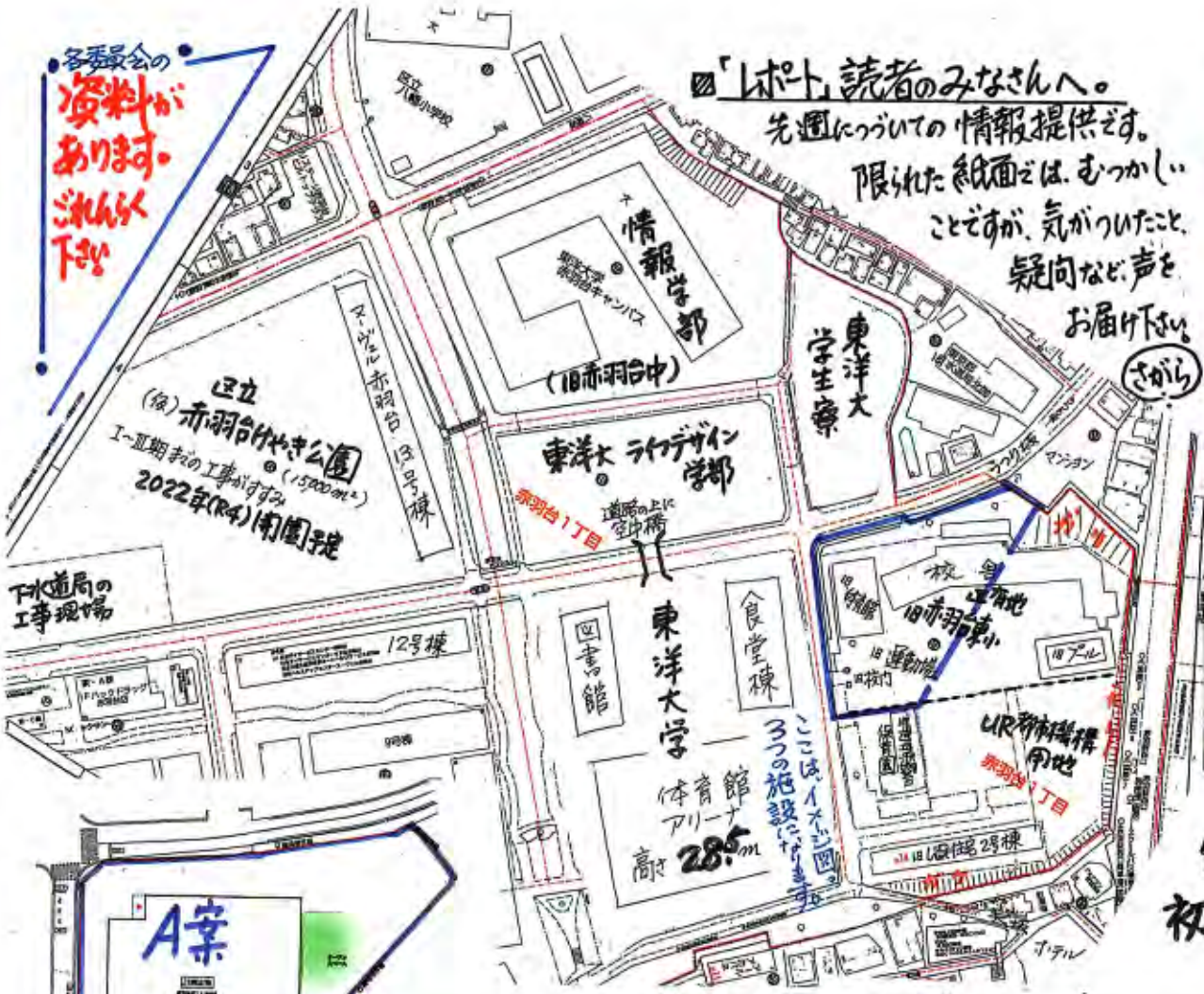
【別図】4(3)「土地譲渡先に求める公共的施設等」のイメージ図

「レポート」読者のみなさんへ。 先週についての情報提供です。 限られた紙面では、むづかしいことですが、気がついたこと、疑問など、声をお届け下さい。 さがら