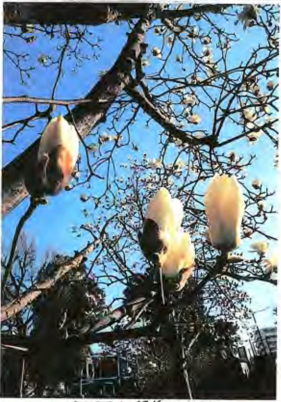
～赤羽台地の緑道 モクレン～

●3カ所あった保健所は、行革の嵐の中、1カ所に。お5波を大きく上回る保健所の逼迫。電話をかけたもかけつながらない—区民の怒りと不安が募りました。 ●党区議団は、保健所の増設を求めるとともに、専門職の確保と拡充を急ごう求めました。 予算の組みかえも提案しています。詳細は次号。