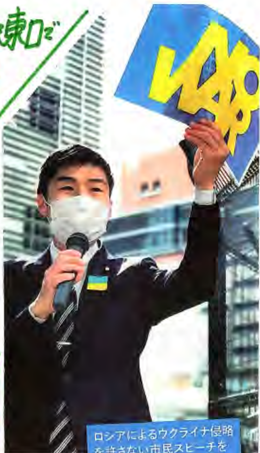
ロシアによるウクライナ侵略を許さない市民スピーチをよびかけ、訴えました。 2022年5月15日 写真