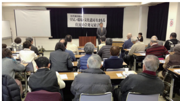
赤羽西86号線に反対する住民の会発足総会

区内3路線4カ所で計画されている特定整備路線。防災に役立たないばかりか、多くの住民を立ち退かせ、コミュニティや文化遺産、自然環境を壊すとして、地元住民から大きな反対運動が起きています。