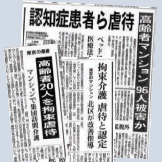
虐待問題を報じる各紙記事

まだまだ足りない特養ホーム。日本共産党は、引き続き施設整備に全力でとりくみます。