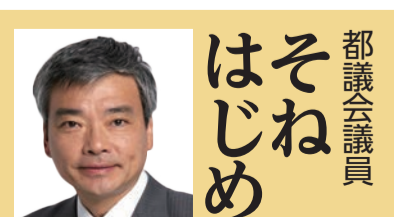
都議会議員 はそね じめ 北区議員団とともに頑張ります