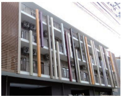
多床室が入った新町光陽苑

北区で特養ホームの入居を希望する待機者は900人を超えています。北区は、政府の方針にそってユニット型（個室）の特養ホーム建設をすすめてきましたが、「せっかく順番がきたのに、個室では料金が高くて入れない。残念だけど、あきらめざるを得ない」との声が寄せられました。そこで日本共産党北区議員団は、料金の安い多床室（4人部屋）の建設も認めるよう東京都に繰り返し要請。2013年に開設にこぎつけた新町光陽苑（田端新町2丁目）では、ついに多床室24床を認めさせることができました。多床室を含む新型特養ホームの建設は、都内で初となりました。