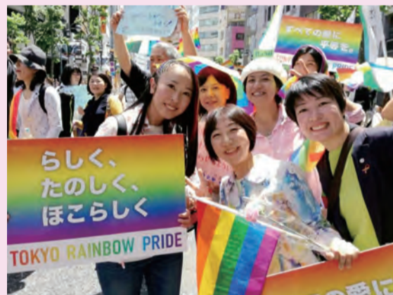
TOKYO RAINBOW PRIDE にて