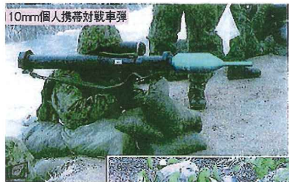
10mm個人携帯対戦車弾

右の写真は2003年から2009年にかけて、自衛隊が「非戦闘地域」イラクのサマワへ派遣されたときに持っていた武器です。安倍首相は国会で、「戦闘地域」で自衛隊が攻撃されたら「武器を使用する」ことを認めましたが、これらの武器で反撃すれば戦闘行為になるのは明らかではないでしょうか