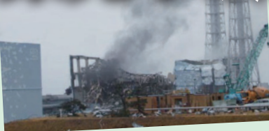
煙をあげる福島第1原発3号機 =3月21日午後4時10分