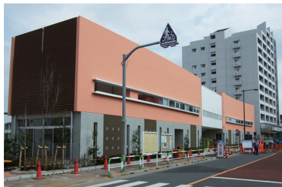
今春開園の西ヶ原南保育園(外語大跡地保育園)

スは、2000年に府中へ移転しました。大学の跡地は現在、西ヶ原みんなの公園や特養ホーム「飛鳥晴山苑」として使われていますが、私はこの間議会でも、かつてこの地に外語大があったことを記す施設をつくるべきだと繰り返し訴えてきました。今回、その主