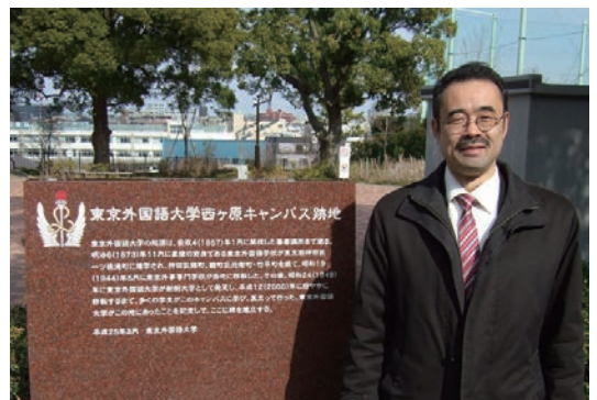
外語大西ヶ原キャンパス跡地記念碑前で

スは、2000年に府中へ移転しました。大学の跡地は現在、西ヶ原みんなの公園や特養ホーム「飛鳥晴山苑」として使われていますが、私はこの間議会でも、かつてこの地に外語大があったことを記す施設をつくるべきだと繰り返し訴えてきました。今回、その主