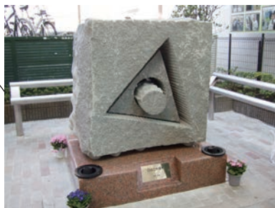
彫刻③「○△□大拙考」 登坂 秀雄 素材：御影石