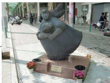
彫刻④「プレゼント」 宮澤 光造 素材：黒御影石