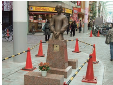
彫刻①「懐」 吉野 毅 素材：ブロンズ