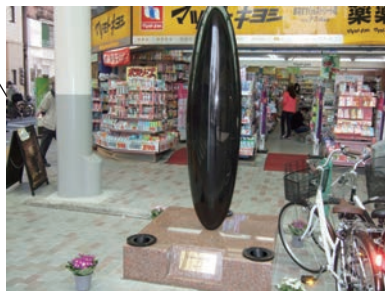
彫刻②「Silent Language」 安田 明長 素材：黒御影石