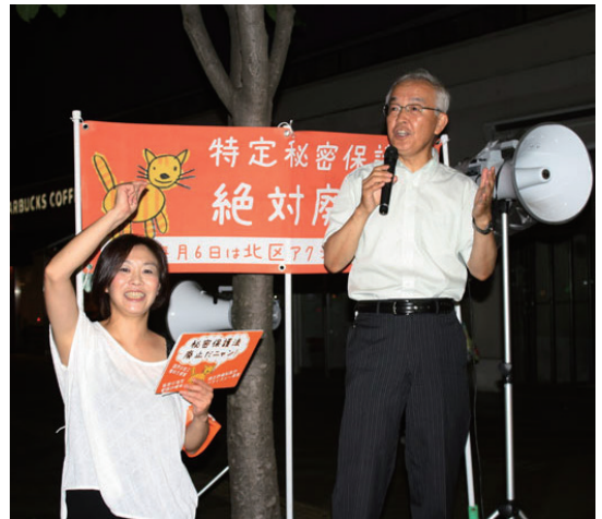
秘密保護法廃止！北区アクション 9月6日

17日の北区議会企画総務委員会で、特定秘密保護法廃止！北区アクション実行委員会が、3195筆の署名とともに提出した「秘密保護法の廃止・撤廃を求める意見書提出」の陳情審査がおこなわれました。 日本共産党の山崎たい子委員は「党議員団が実施している区民アンケートでも秘密保護法反対は60%にわが党は国会にも秘密保護法廃止法案を提出している。民主主義をふみにじり、『戦